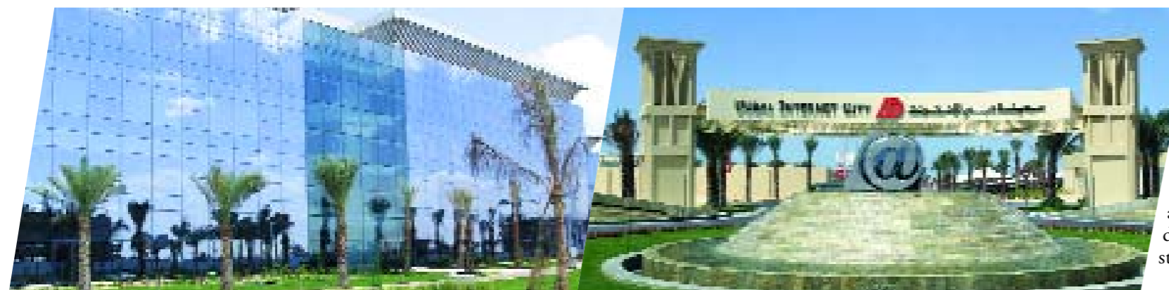
Tra palme e laghetti artificiali si sviluppa Dubai Internet City, il primo e unico polo telematico del Medio Oriente.

Un successo indiscusso che ha portato, nel gennaio di quest'anno, all'apertura di Dubai Media City, gemella dell'altra città digitale voluta con l'intento di allargare ancor di più la zona commerciale libera dalle imposte. Proprio l'assenza di tasse, l'efficienza delle infrastrutture e il basso costo della manodopera hanno poi fatto il resto. Un connubio vincente arricchito dall'indubbia tranquillità e sicurezza della piccola città-Stato che si è mostrata come un'oasi di pace rispetto ad un Occidente pericolosamente attraversato da conflitti irrisolti. A Du-